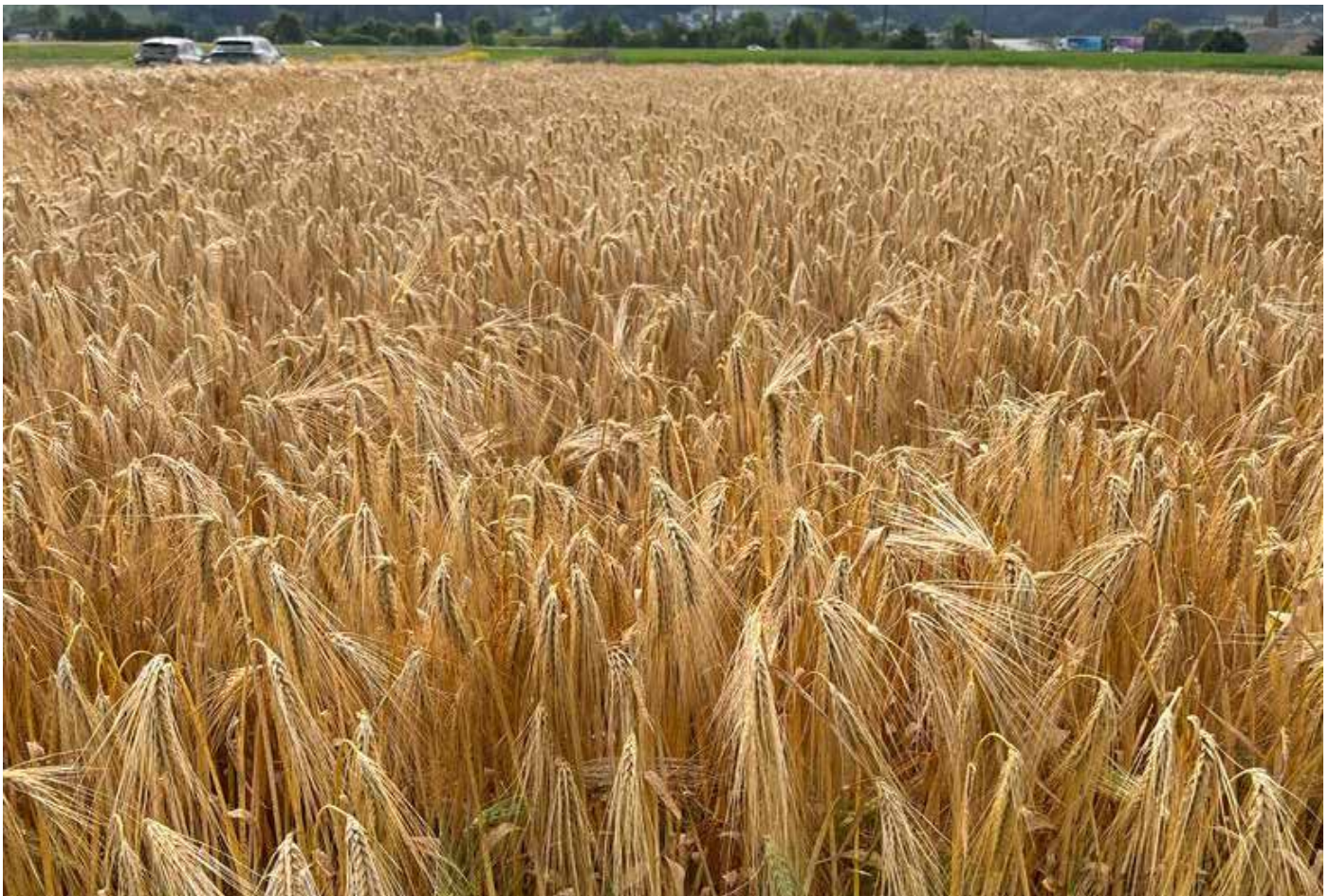
Variété: SY Kingston

Pour plus de résultats d'essais, visitez www.feldtage.ch/fr